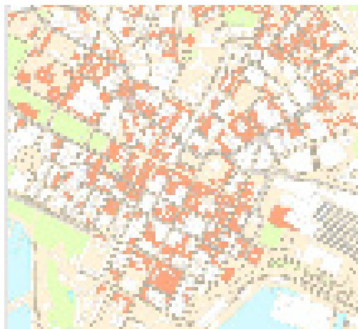
Kartutsnitt av 1800-talls murbebyggelse.