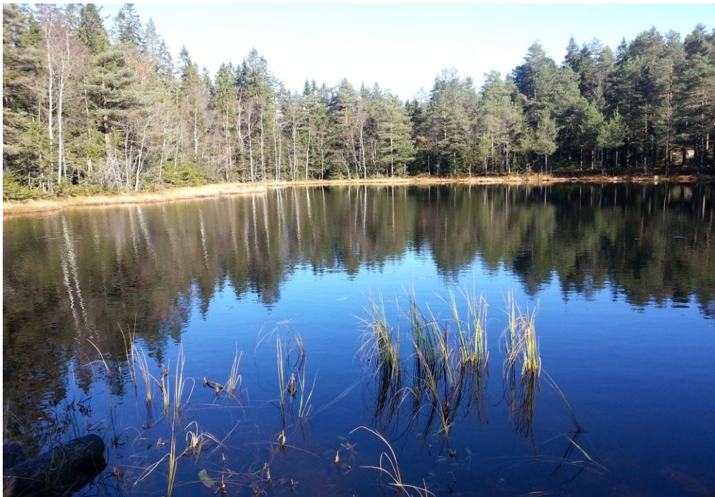
Høstidyll ved Bamsetjern