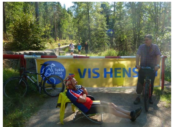
Fra fjorårets "Sykle med hue"-aksjon

21. august vil vi delta på OOF sin planlagte kampanje, «Sykle med hue». Kanskje sees vi da.