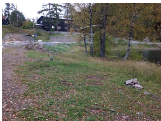
Redusert strandområde ved Kapteinsputten

Planendringene på Linderudkollen skiarena førte som kjent til ekstra store inngrep i 2015. Det var først og fremst saksbehandlingen i Oslo kommune Lillomarkas Venner reagerte på, med manglende innsyn. Nå, etter vinteren, kan man se hvordan det ser ut på sommerstid. De store løypene dominerer nå fullstendig rundt Linderudkollen, men det ser naturlig nok ikke like ille ut som det gjorde i den hardeste utbyggingsperioden. Løypeskuldrene er for det meste dekket pent til, de skal gro til med naturlig vegetasjon. Blå-stiene er ryddet for kvist – men delvis forsvunnet i løypene.