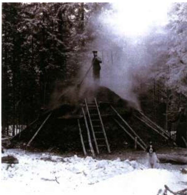
Omtrent slik tok kullmila seg ut. Bildet er fra Flesberg i Buskerud ca. 1900.