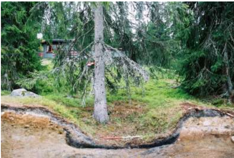
Snitt av kullgrop i Sigdal. Illustrasjon ved Unni Grøtberg